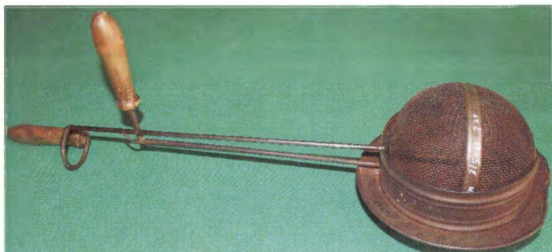
10. Rukávce Zliechov přírastkové číslo : 116/89 evidenčné číslo : 1367/E